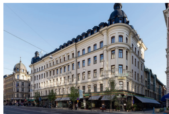
Elite Hotel Adlon.